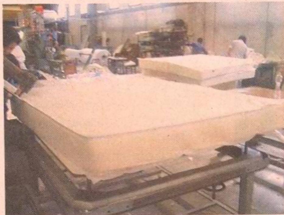
Specialità. A Prato la produzione di materassi ha una tradizione radicata